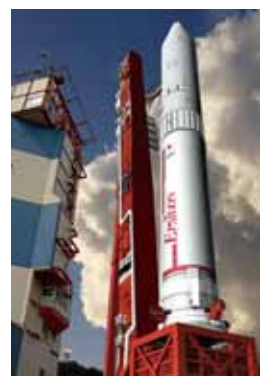
イプシロンロケット

タンクの押しガス減圧に使う緊急減圧設備と、有毒環境下での作業者の呼吸空気用に低圧かつ大流量の清潔な圧縮空気を送る空気呼吸器設備の製作に携わりました。お客さまのご要望に合わせ、複雑な設計にも対応する組み立て・加工を迅速にご提案し、結果として、ロケットの打ち上げと衛星の軌道投入成功に貢献することができました。