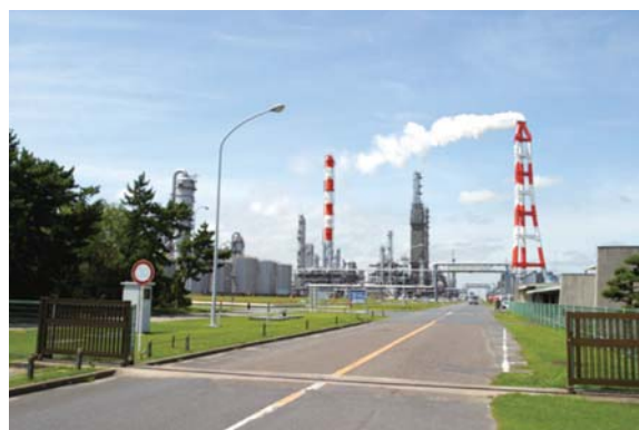
三菱化学 鹿島事業所

総合化学メーカーである三菱化学株式会社の鹿島事業所は、日本有数の石油コンビナートである鹿島コンビナートに位置し、ナフサを原料とする石油化学製品を生産しています。ここではこれまで長年使用してきた分析器（プロセス・ガス・クロマトグラフ）を最新化することになりました。しかし、分析器の交換にあたり、分析システムの前処理工程であるサンプル・コンディショニング・システムにいくつか気になる点がありました。例えば、その一つがフィルターの閉塞です。フィルターの目詰まりが分析器の故障、応答不良など不具合の原因となっており、毎月の度重なるフィルター・メンテナンスに悩まされていたのです。多くの部品で構成されている分析システムは、その仕様が標準化されておらず、操作も一様ではありません。特定の担当者しか操作できない機器や部品もあるため、数名の専門員がプラントの100台以上の分析システムを管理し、それにかかる労力は多大なものでした。そしてこれらは、分析器を最新化しただけでは、解決できない問題でした。そのため、分析器の交換を機に、サンプル輸送ライン、サンプル・コンディショニング・システムを含む分析システム全体の改善・改良を検討することになったのです。